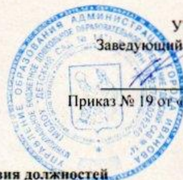
Таблица соответствия должностей